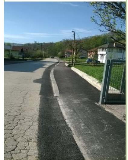
RAD ORGANA MZ 2016

MZ partner UNDP u projektu “Jačanje uloge MZ u BiH”