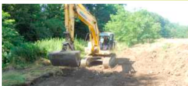
MZ Jelah-izgradnja puta Rastoke