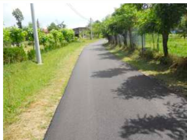
MZ Kraševo – dionica puta Mezarje-Ogrići