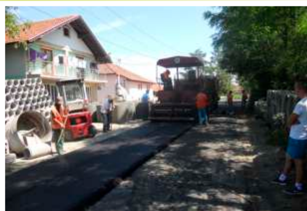
MZ Miljanovci – dionica puta Osnovna škola-Sarači