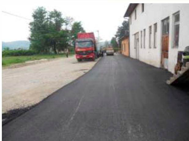
MZ Novi Miljanovci - Donja mahala-Gobelja