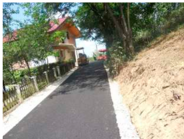
MZ Raduša - dionica puta Uno-Mehuljići-Mešići