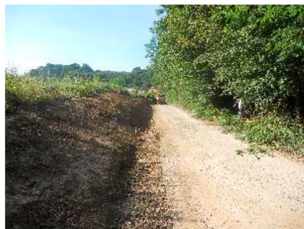
MZ Rosulje – dionica puta Agići-Bajina Glava