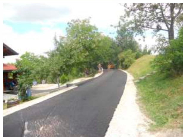
MZ Bukva - dionica puta Toplana-Čifluk