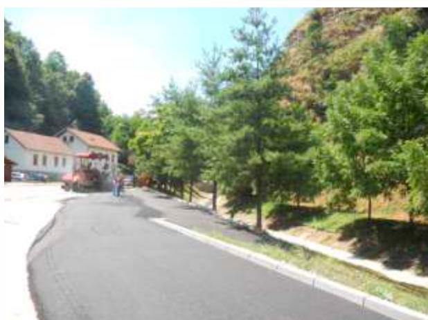
Parking kod Centra za socijalni rad