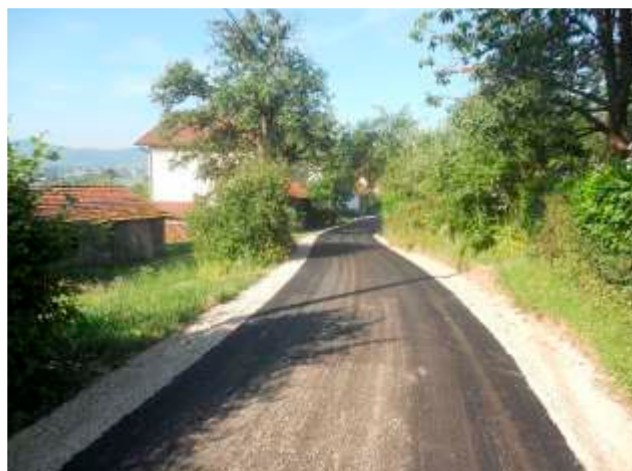
MZ Jevadžije – dionica puta Karahodžići