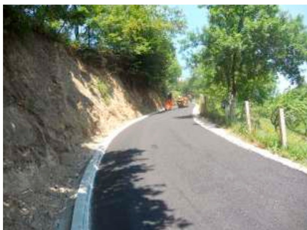
MZ Karadaglje – dionica puta Beše-Bahtići